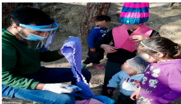
foto kamp Samos uitdelen mutsen en sjaals

Wij verstuurden meer dan 1000 mutsen en sjaals naar Athene en kamp Vathy op Samos. Deze keer was er was voor elk wat wils. Later hoorden we dat de kinderen in het kamp zo blij waren dat ze eindelijk een keer zelf de kleur of het model mochten kiezen. Er wordt nog steeds gebreid en een ieder die na het lezen van dit stukje ook wil gaan breien; wees welkom! Laat het ons even weten zodat we uw woonplaats op de kaart kunnen bijvoegen.