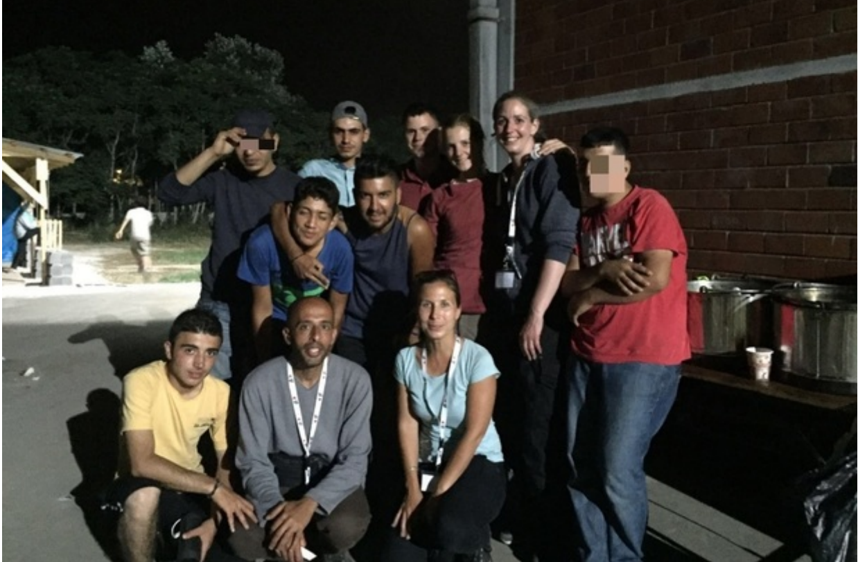
Chai team in Sindos